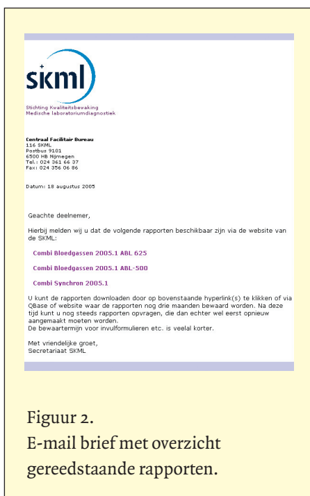
Figuur 2. E-mail brief met overzicht gereedstaande rapporten.

Als onderdeel van het vrijgeven van de ronde, zullen alle rapporten worden aangemaakt en dus via QBase beschikbaar zijn. Tevens zijn de rapporten via de website opvraagbaar. Zodra alle aan te maken rapporten gereed zijn, wordt er per deelnemer (rapportontvanger) een e-mail verzonden met daarin voor elk cluster een hyperlink (b.v. Hepatitis ABC 2005.1) die verwijst naar het rapport dat op de centrale server staat te wachten om gedownload te worden. U ontvangt dus niet meer per cluster een e-mail met daaraan als bijlage het rapport, maar slechts één bericht waarmee u op eenvoudige wijze alle gereedstaande rapporten kunt opvragen. Door deze